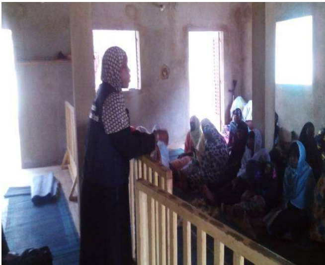
Séance de sensibilisation des femmes à la Mosquée WAMY Hamdallaye Commune IV/District Bamako