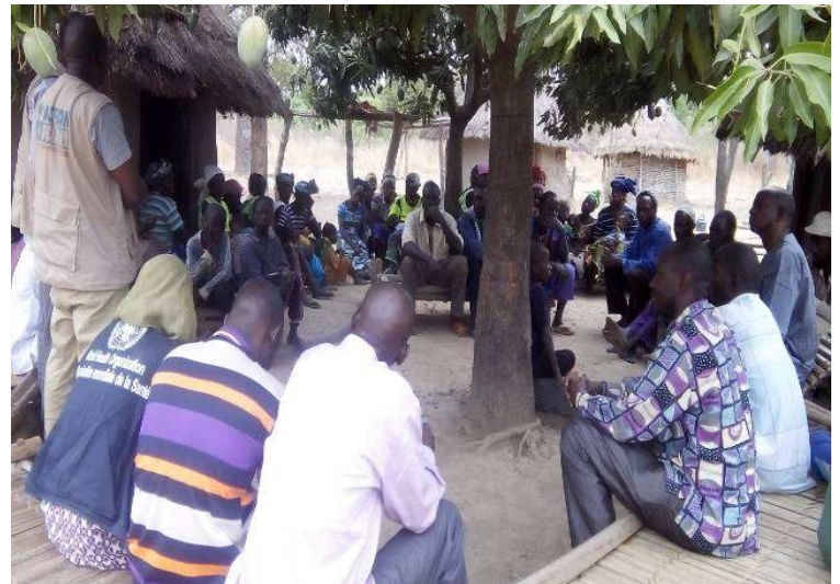
Séance d'information et de sensibilisation à Badala (Baléa) Kita Mission d'investigation

La carte ci-dessous renseigne sur la localisation des cas confirmés et probables.