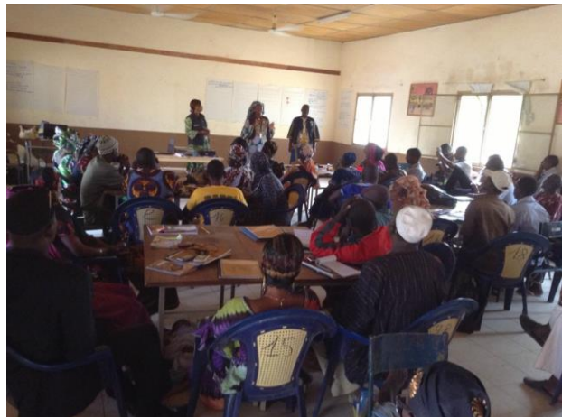
Séance d'information et de sensibilisation de 36 ASC et 12 DTC Adjoints du district sanitaire de Kangaba

La carte ci-dessous renseigne sur la localisation des cas confirmés et probables.