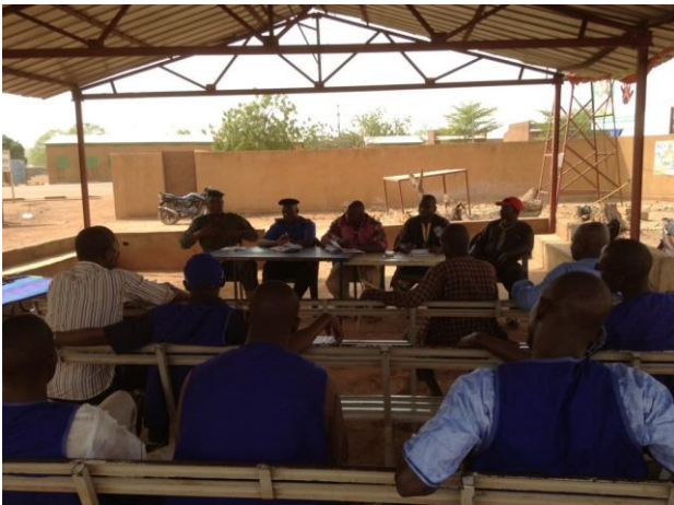
Réunion hebdomadaire du comité local de gestion de crise de Kourémalé sur la MVE