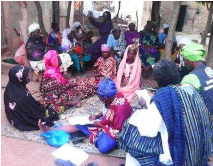
Dialogue communautaire à Kourémalé