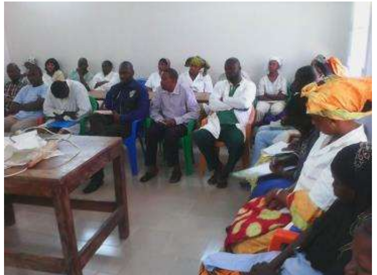
Restitution des résultats de l'évaluation rapide sur la prévention et le contrôle de l'infection au CSREF et au CSCOM central de Kangaba