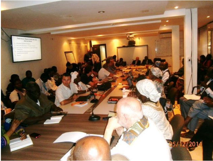
Photo : Réunion de la Task Force à l'OMS le 03 décembre 2014.