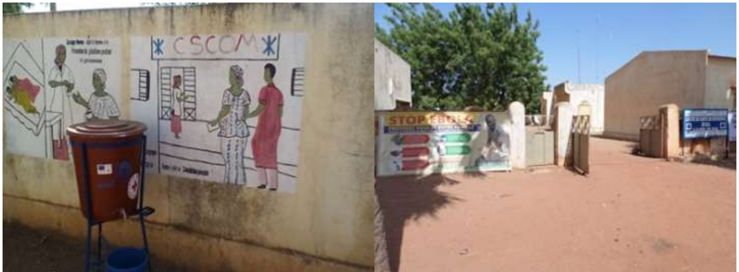
Images de sensibilisation au CSCOM central de Barouéli et au CSRef de Bla, Région de Ségou