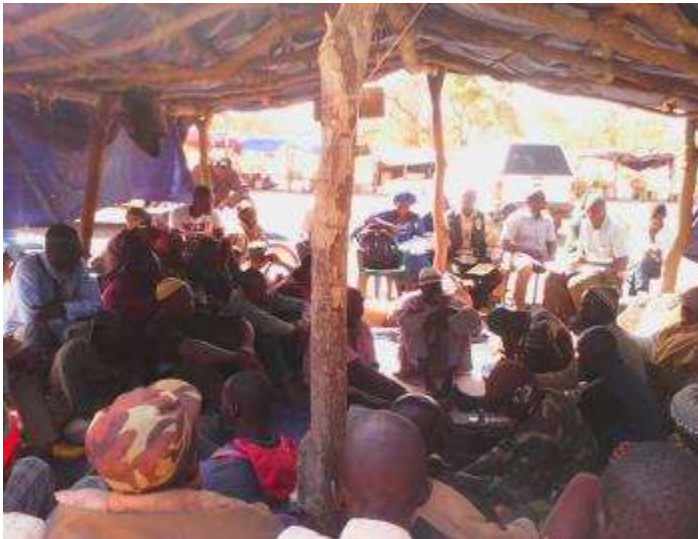
Sensibilisation de managers (Tomboloma) du site d'orpaillage de Nanbarafioni de Kourémalé Mali