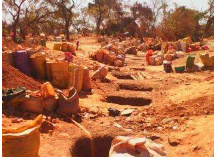
Site d'orpaillage de « Nanbarafioni » de Kourémalé Mali