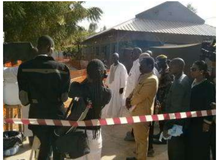
Visite du Premier Ministre au Centre Opérationnel d'Urgence (COU)