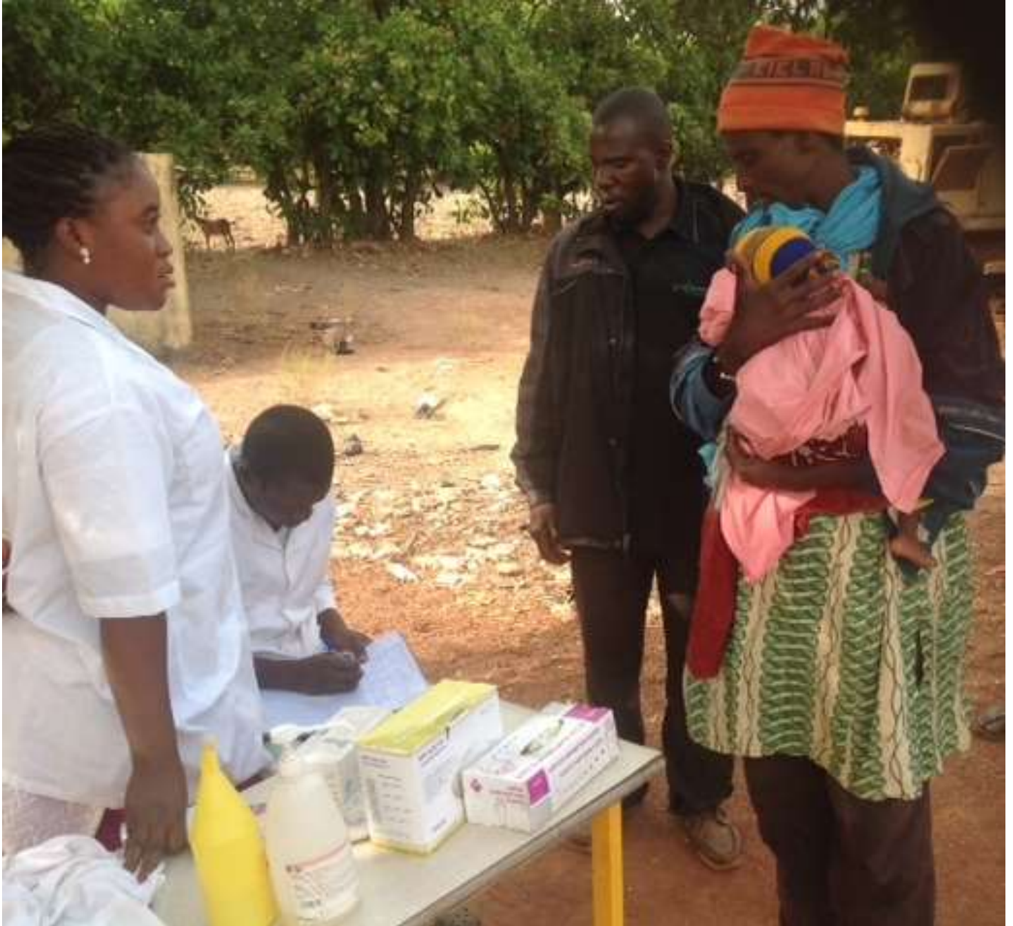
Cordon sanitaire de Sélingué dans la Région de Sikasso pour la surveillance épidémiologique de la MVE