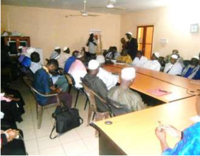
Concertation avec les leaders religieux à Bamako