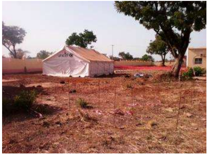
Site d'isolement du CSREF de Kangaba