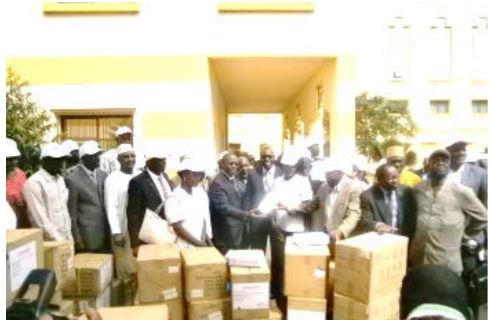
Photo 1 : Remise d'un lot kit de protection contre la MVE au Ministère de la santé par la diaspora Malienne