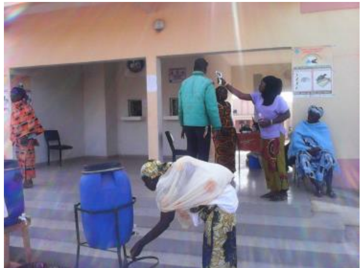
Photo 1 : Formation des agents de santé sur la prise en charge de la MVE