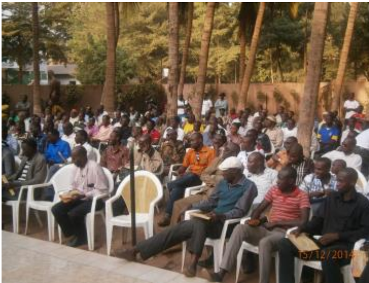
Photo 1 : Participants à l'émission interactive des jeunes sur la MVE à l'émission « Allo Klédu ».