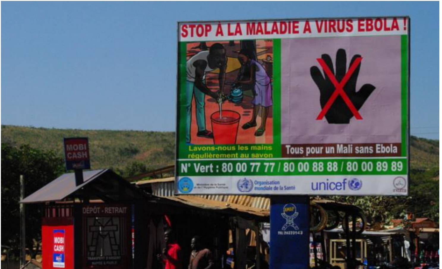
Photo 1 : Panneau de sensibilisation les mesures préventives de la maladie à virus Ebola à Bamako.