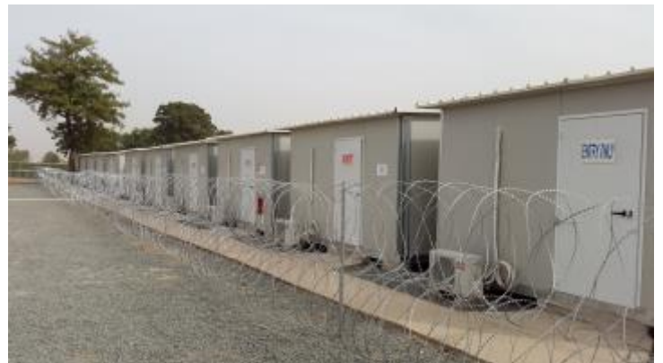
Photo 2 : Centre de traitement Ebola de la MINUSMA situé à Bamako Senou.