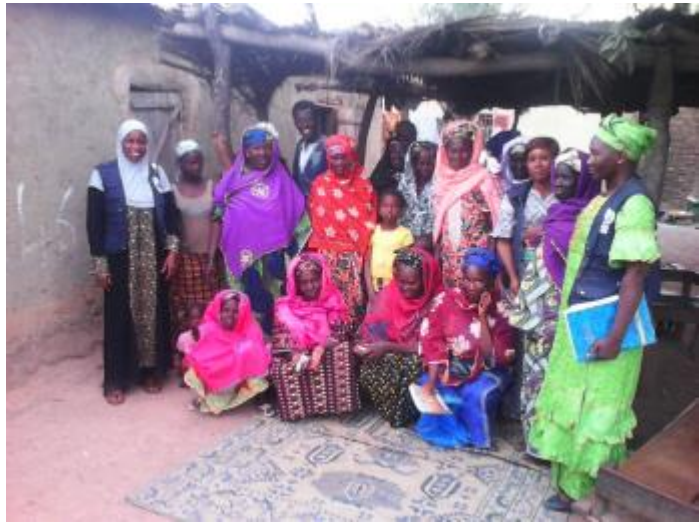
Photo 1 : Séance d'information et de sensibilisation du groupement de femmes «Manden ton » de Kourémalé Mali sur la maladie à virus Ebola.