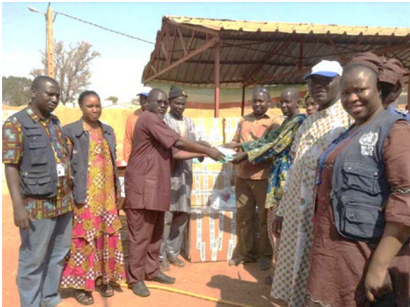
Cérémonie de remise de lots de matériels et Kits de protection au CSCOM de Kourémalé par l'Alliance de la société civile