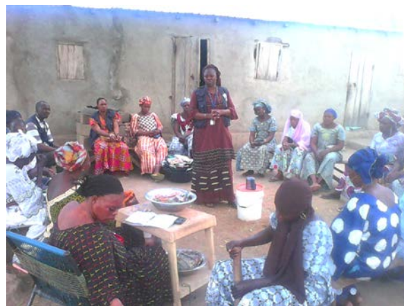
Séance d'information et de sensibilisation auprès du groupement de femmes « Benkadi » de Kangaba sur la MVE par l'équipe OMS/Kangaba-Kourémalé et le SLDSES de Kangaba contre la MVE avec son partenaire « Arche Nova »

La carte ci-dessous renseigne sur la localisation des cas confirmés et probables.