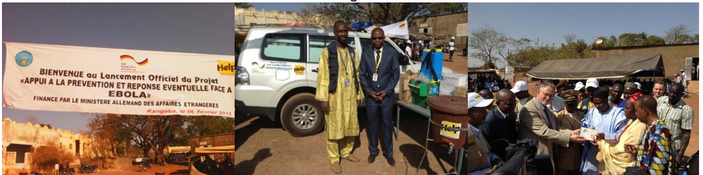
Cérémonie de lancement du Projet « Appui à la prévention et réponse éventuelle face à Ebola » et Remise des lots de matériels de protection contre Ebola par l'ambassadeur d'Allemagne au Mali

La carte ci-dessous renseigne sur la localisation des cas confirmés et probables.