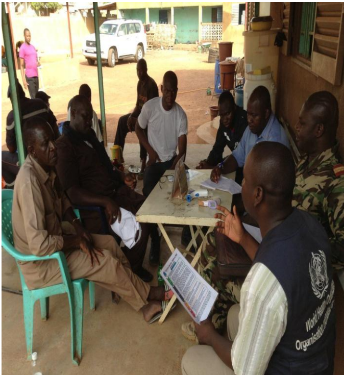
Renforcement de capacités sur les mesures de prévention et de lutte contre la MVE de 6 agents de la protection civile pour les cordons sanitaires. Formateurs : équipe OMS Kangaba / Kourémalé ;