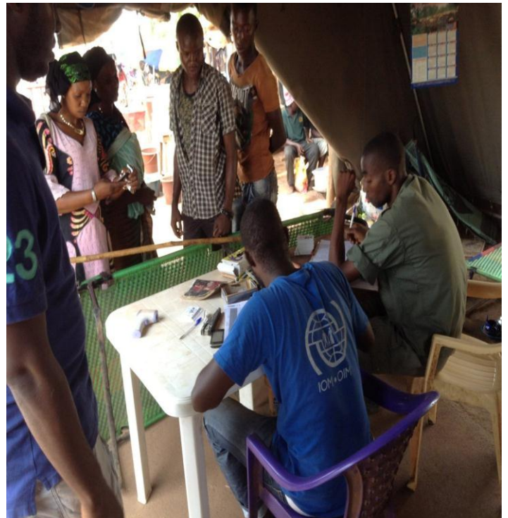
Visite des cordons sanitaires de Kourémalé par l'équipe OMS Kangaba