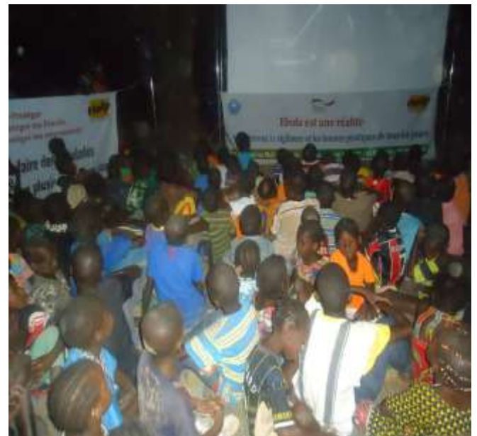
Poursuite de la campagne de sensibilisation de masse sur les mesures de prévention et de lutte contre cette maladie