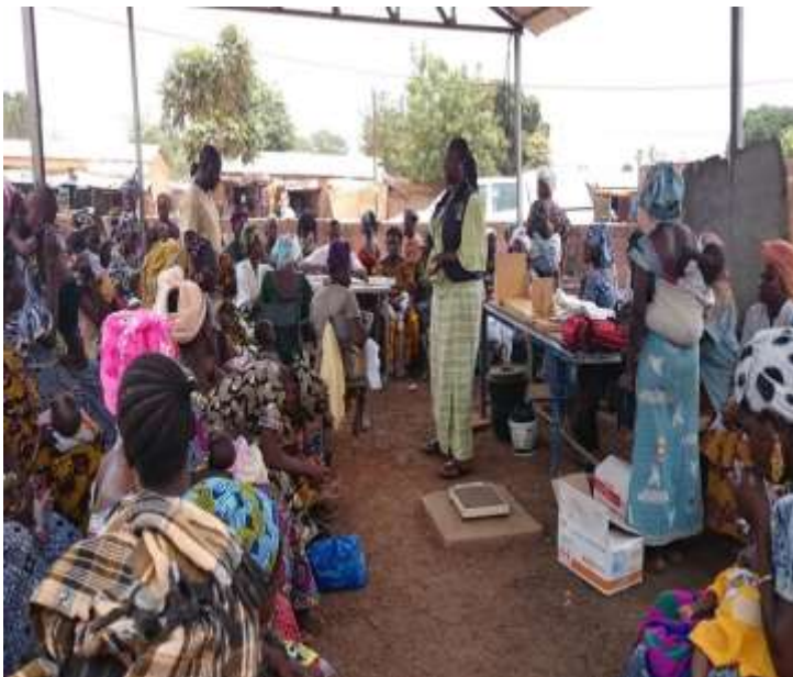
Séance d'information et de sensibilisation de 66 mamans sur les mesures prévention et de lutte contre la MVE au CSCOM de Narena (Kangaba)