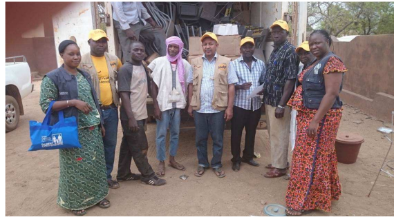
Remise d'importants lots de matériels et d'équipements par HELP au district sanitaire de Kangaba