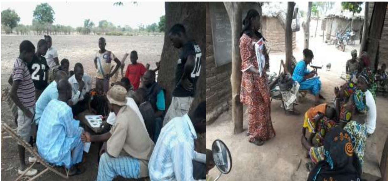
Séances de test de la boîte à image sur la MVE dans le village de Lamina, cercle de Kita par les services de la DNDS et l'OMS