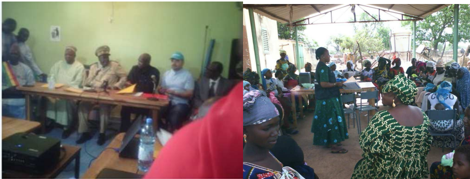
Présidium de la rencontre transfrontalière Guinée –Mali à Kita