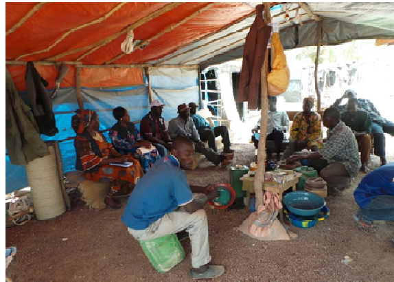
Sensibilisation de l'association « Tombolomas » du site d'orpaillage de Ballandougou sur la MVE dans l'aire de santé de Kourémalé