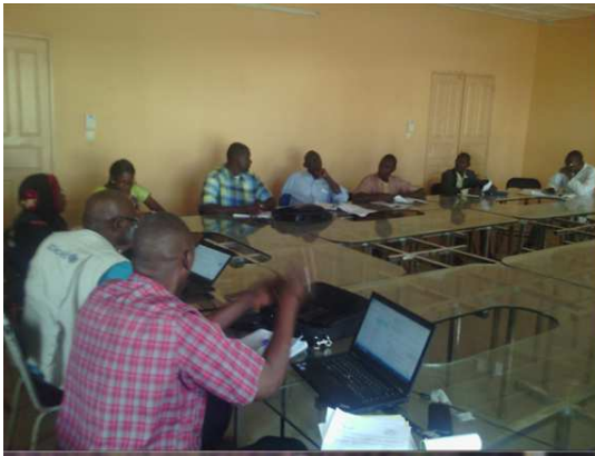
Réunion préparatoire de la rencontre transfrontalière Guinée –Mali à Kita